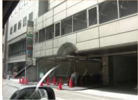
地上に立番人と思われる人を確認