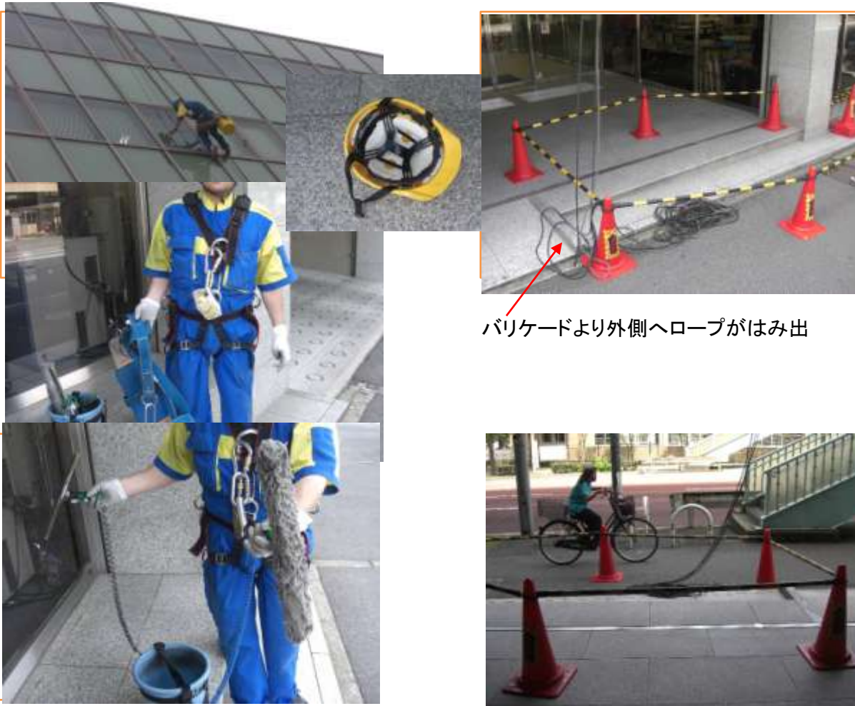
バリケードより外側へロープがはみ出